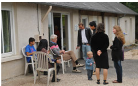
Salle d'Aubevoye - 2012

Lorsque l'association culturelle a été créée nous avons souhaité nous réunir dans un lieu plus accessible. Nous avons alors organisé nos rencontres et