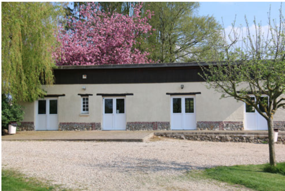
La salle de Corny - 2019

nos activités (cultes, parcours Alpha, spectacles de Noël, repas...) dans la petite ville d'Aubevoye, dans un local appartenant lui aussi à la paroisse catholique. Nous y sommes restés plusieurs années, tissant des liens chaleureux avec nos amis catholiques.