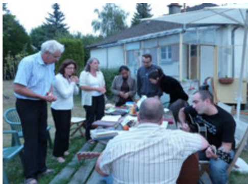
Les débuts... 2009, moment de louange en extérieur à Houlbec-Cocherel

Cette évolution de notre communauté a été accompagnée de plusieurs déménagements. Au départ, dès l'année 2005, nous nous réunissions chez une famille près de Vernon, à Saint Just puis à Houlbec-Cocherel.