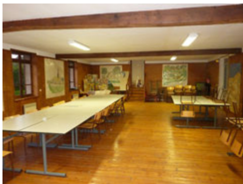
Presbytère de Houlbec Cocherel - 2011

Dans ce même village nous nous sommes ensuite installés dans une salle prêtée par la paroisse catholique.